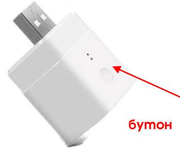
бутон + индикатор